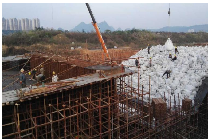
建设中的滨江路景观桥工程