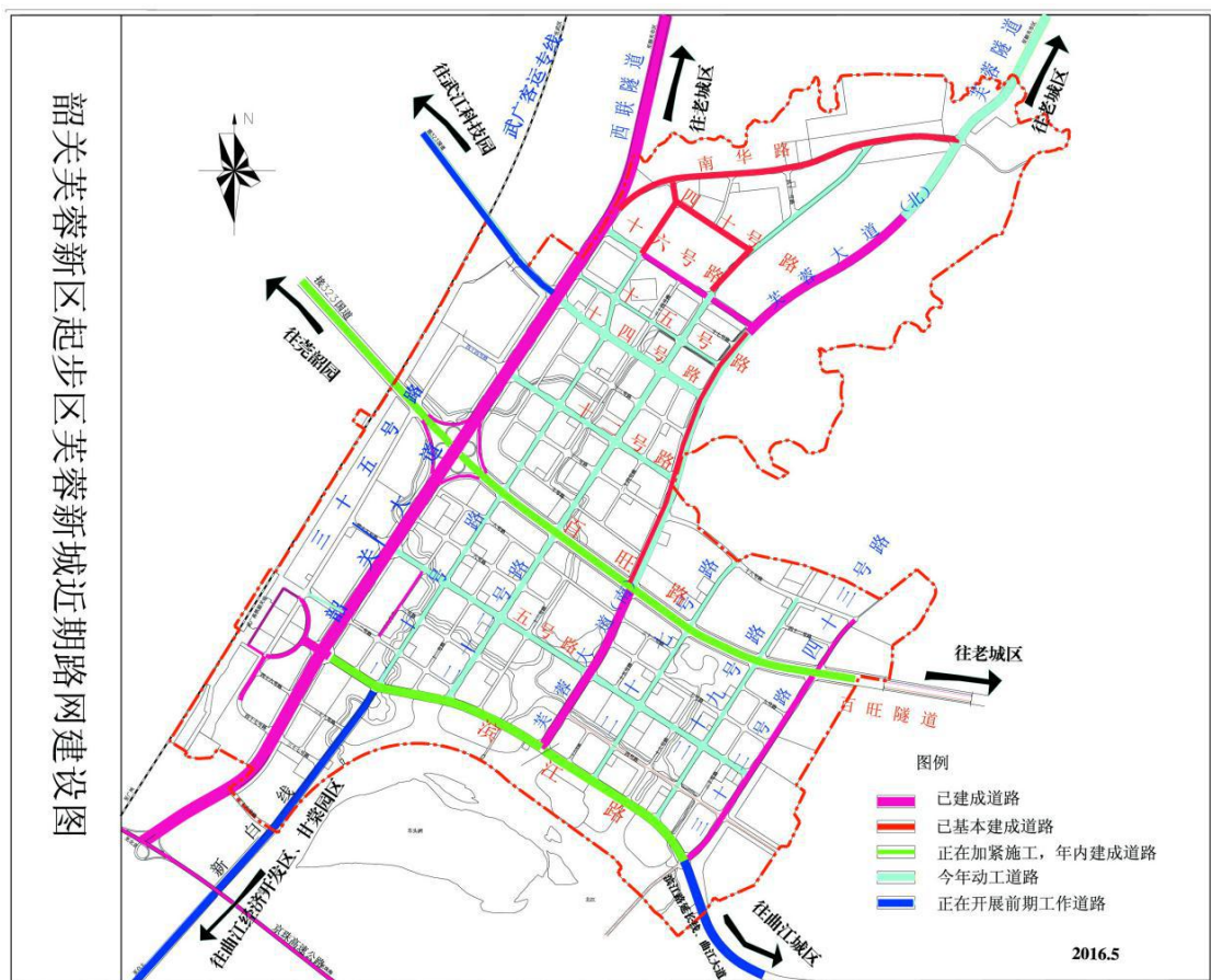
韶关芙蓉新区起步区芙蓉新城近期路网建设图

作为新城路网的建设主体，韶关城投集团将认真梳理道路建设中存在的问题，积极主动地寻求解决办法，进一步加强施工管理，强化工程监理和检查，确保各项工程质量，争取早日向社会交出满意答卷。