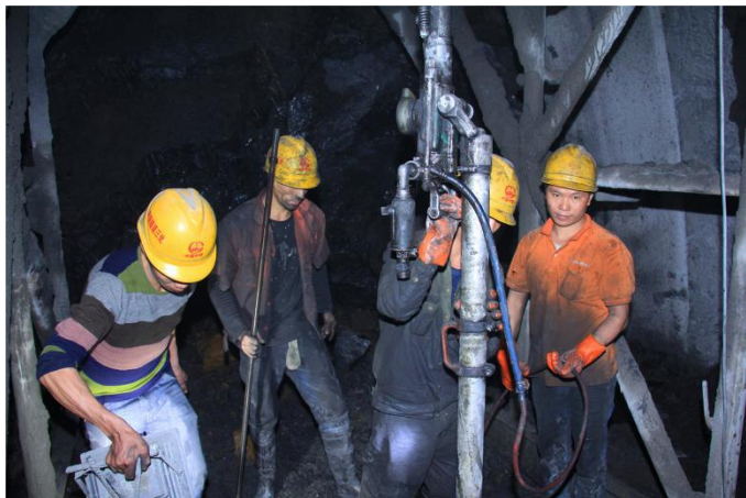
芙蓉隧道内部施工现场