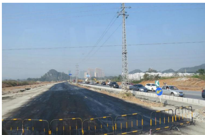
建设中的百旺路扩建工程