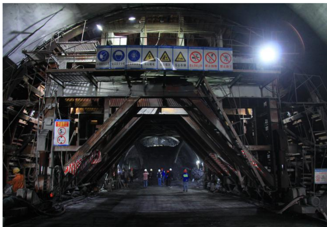
芙蓉隧道内部施工现场