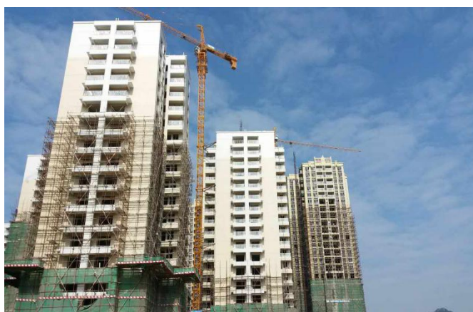
韶关市国有工矿棚户区改造(二期)工程